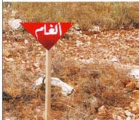
المثلث الأحمر (ألغام)