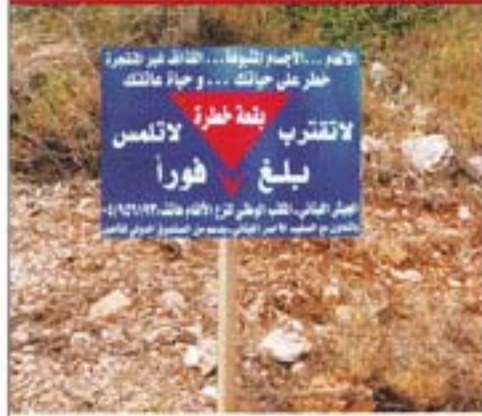
المربع الأزرق + مثلث (ألغام)