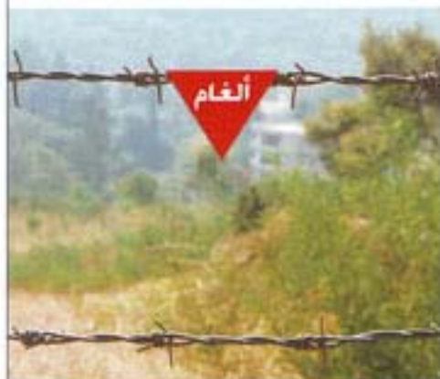
شريط شائك + مثلث (ألغام)